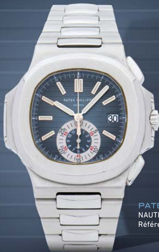
PATEK PHILIPPE NAUTILUS CHRONOGRAPH. Référence 5980/1A.