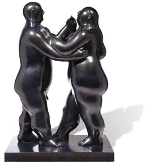
FERNANDO BOTERO Dancing couple, 2012 Epreuve en bronze à patine noire Adjugée : 1 400 000 €

Nous pouvons garantir sur le même contrat les œuvres d'art et de collection, les montres et les bijoux. Le contrat est adapté en fonction des nouvelles acquisitions et les biens sont assurés en monde entier et ce même en cours de transport.