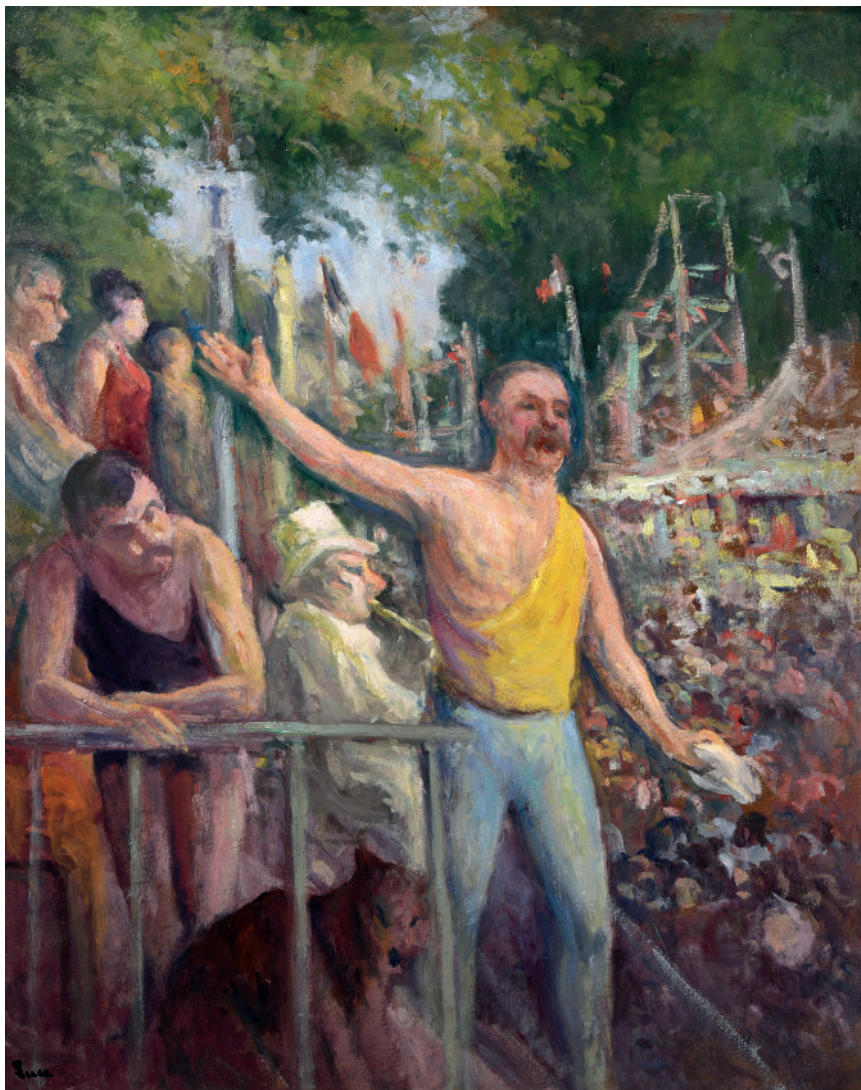
MAXIMILIEN LUCE (1858-1941)