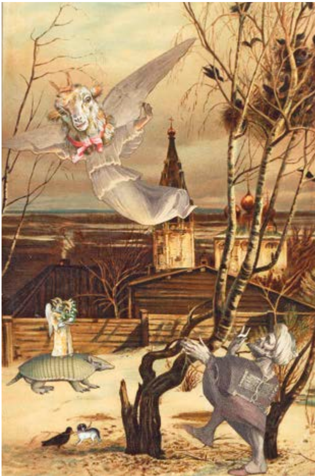
JACQUES PRÉVERT (1900-1977) D'un ensemble de collages et documentations provenant d'une famille d'amis