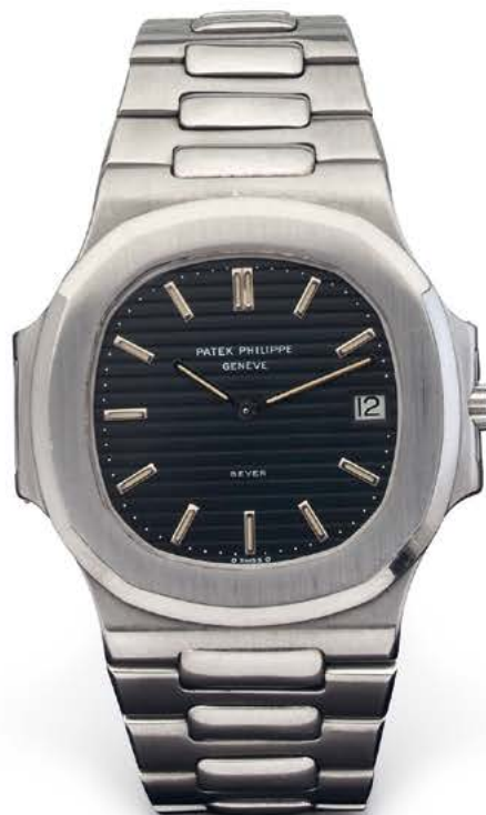
PATEK PHILIPPE Nautilus