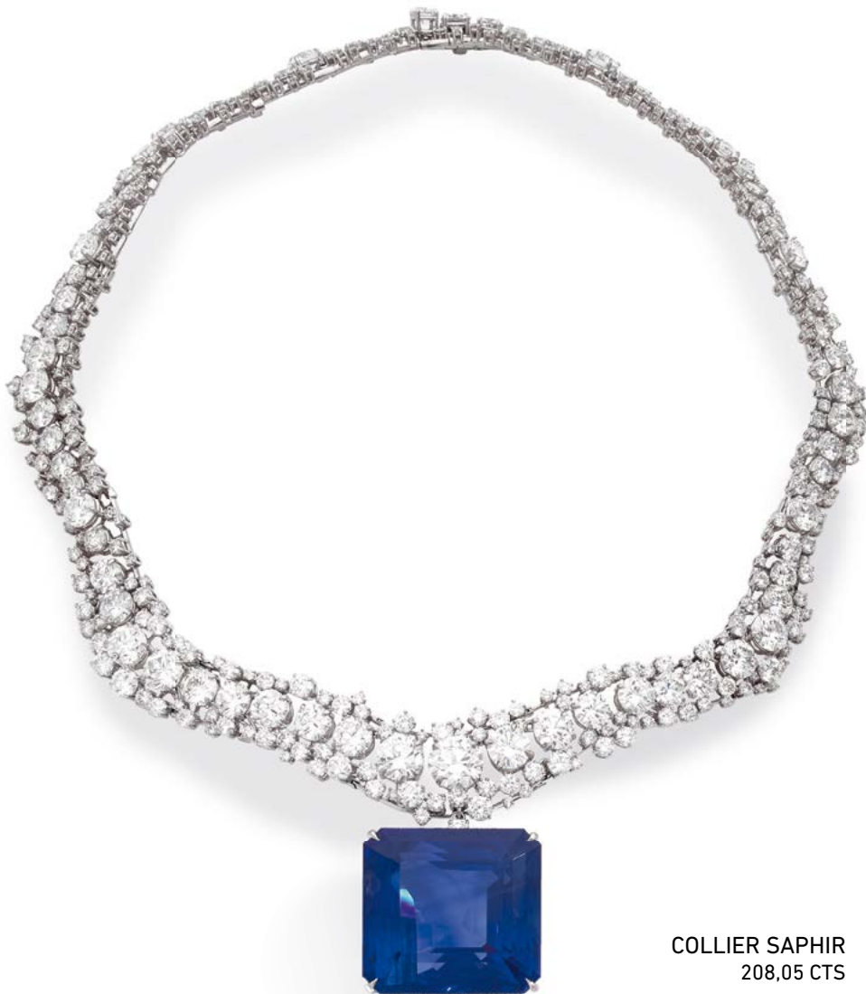
COLLIER SAPHIR 208,05 CTS