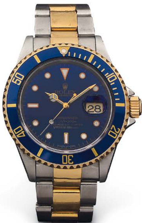
ROLEX Submariner Oyster