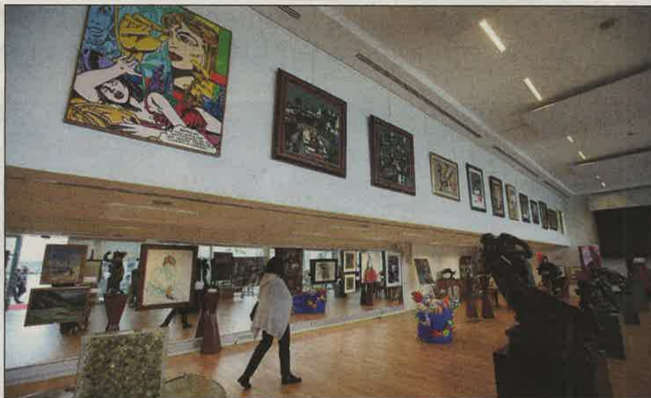
Avant d'être mis aux enchères ce soir, dès 18 heures, les 107 lots peuvent être admirés jusqu'à ce matin au Yacht-club de Monaco.

Au catalogue, les collectionneurs ou particuliers, sensibles à l'art, n'auront pas